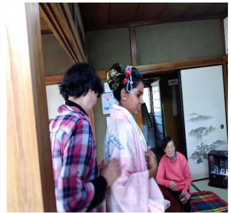
日本文化の体験に感激して いました