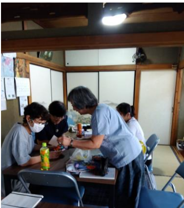
失敗しても怒らない折り紙 の先生