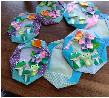
童心に帰って折り紙教室