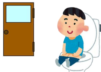
トイレ入口の表示