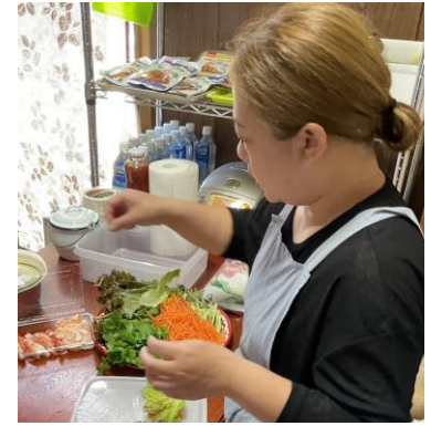
みんなのいえでの料理教室